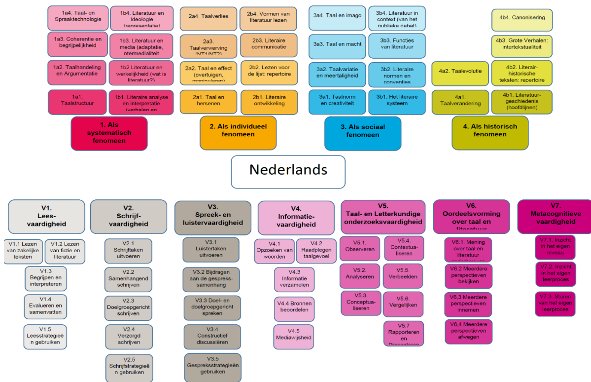
Figuur 1: Voorstel voor een nieuwe leerdoelenkaart Nederlands (2018)

We gaan ervan uit dat het bij taal, taalgebruik en literatuur voor een belangrijk deel gaat om de relatie tussen vormen en betekenissen . De perspectieven leiden tot het inzicht dat er systeem zit in taal- en tekstvormen en hun relatie met betekenissen, en dat dit systeem samenhangt met eigenschappen, voorkeuren en beleving van individuele taalgebruikers in hun sociaal-culturele en historische context.